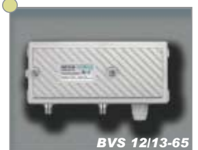
BK-Verstärker CATV amplifiers