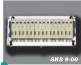
QPSK/PAL-Kopfstelle QPSK/PAL head end