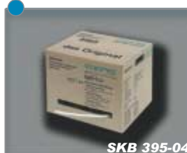
3fach geschirmtes Koaxialkabel 3-way shielded coaxial cable