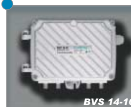
BK-Verstärker CATV amplifiers